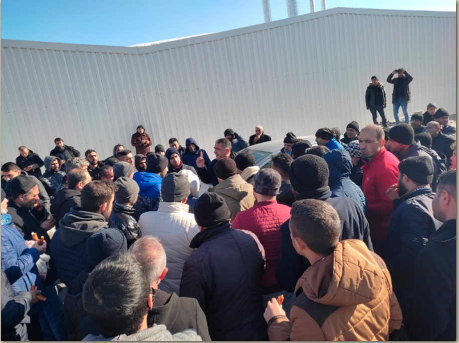
Şireci Tekstil İşçileri