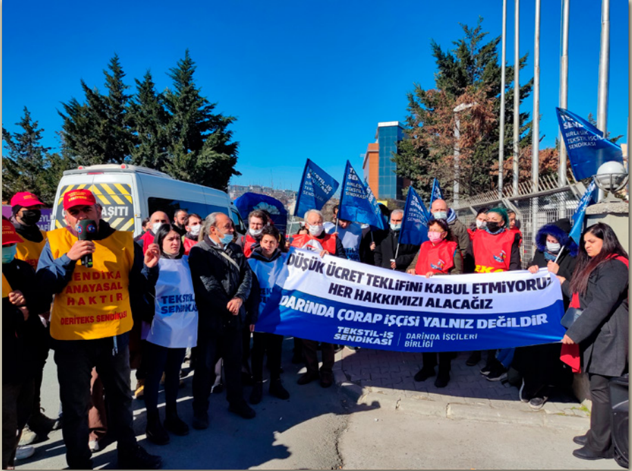
Darında Çorap İşçileri